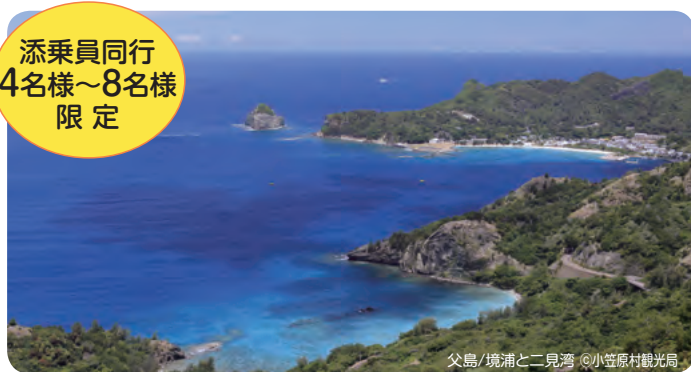
父島/境浦と二見湾