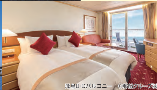
飛鳥II・Dバルコニー