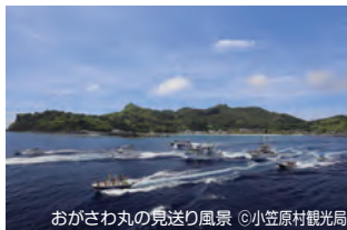
おがさわら丸の見送り風景