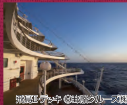
飛鳥II・デッキ