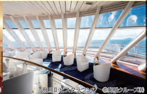
飛鳥II・ビスタラウンジ