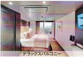
デラックスバルコニー