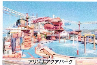
アリゾナアクアパーク