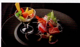
駿河湾沼津市場直送 鮮魚のお造り盛り合わせ