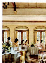
パーティー 会場貸切り