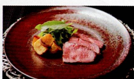
シェフ特製 ローストビーフ