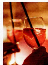
ドリンク 飲み放題付き